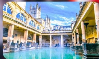
โรงอาบน้ำโรมันบาร