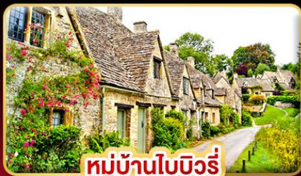
หมู่บ้านโบบิวรี่