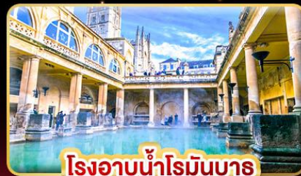
โรงอาบน้ำโรมันบาร