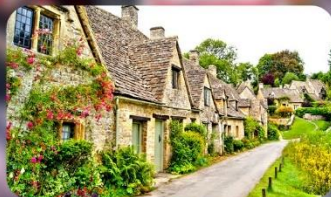
หมู่บ้านไบบิวรี่