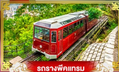
รถรางพิกแรม