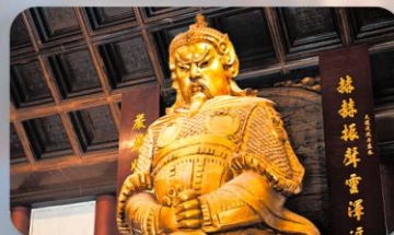
วัดเซ่งกง