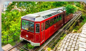
รถรางพักผ่อน