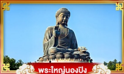
พระใหญ่นองปิง