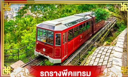
รถรางพิกเกอรัม