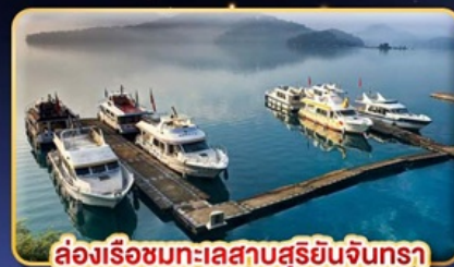
ล่องเรือชมทะเลสาบสุริยันจันทรา