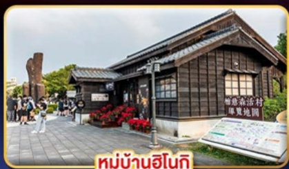
หมู่บ้านฮินเก้

"ไทเป" มแดนแดนแห่งเมืองสีกัน เที่ยวใจ เช็คอินจุดไฮไลท์