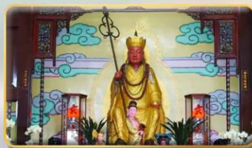
วัดพระถังซำจั๋ง