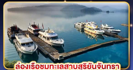
ล่องเรือชมทะเลสาบสุริยันจันทรา