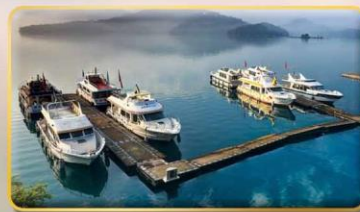
ล่องเรือชมทะเลสาบสุริยันจันทรา