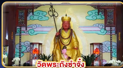
วัดพระถังซำจั๋ง