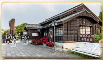
หมู่บ้านฮิโนกิ