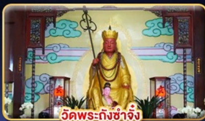
วัดพระถังซำจั๋ง