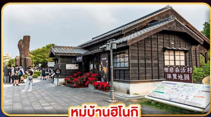
หมู่บ้านฮินกิ

"ไทเป" มหานครแห่งเมืองสีัน เทียวใจ เช็คอินจุดไฮไลท์