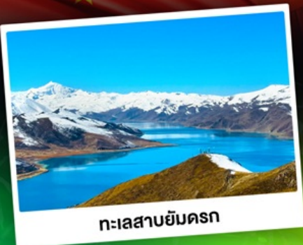
ทะเลสาบย๋ันครก