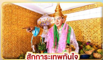
สักการะ-เทพทันใจ