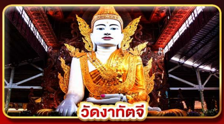
วัดงาทัดจี