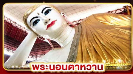
พระบอนตาหวาน