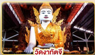
วัดหงาทัดจี