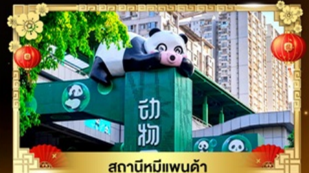
สถานีหมี่แพนด้า