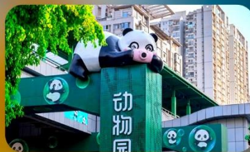
สถานีหมีแพนด้า