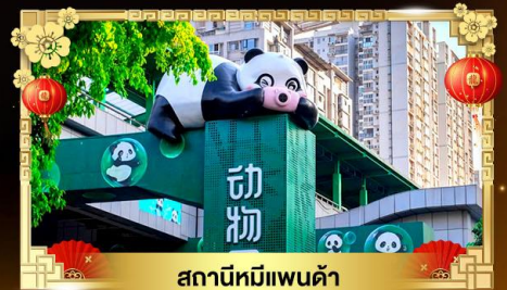
สถานีหมีแพนด้า