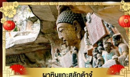
มหาหินแกะสลักคำจู่