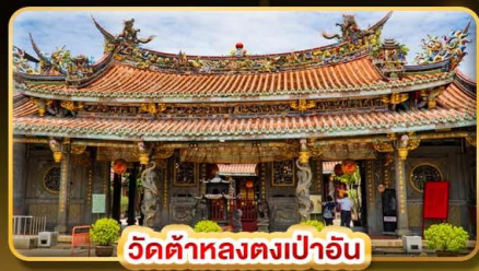
วัดต้าหลงตงเป่าอัน