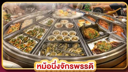
หม้อหนึ่งจักรพรรดิ

แพคเกจรวมตั๋วเครื่องบิน บินคุ้ม เทียวครบ เช็คอินทุกจุดไฮไลต์