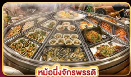
หม้อนึ่งจักรพรรดิ

แพคเกจรวมตั๋วเครื่องบิน บินคุ้ม เที่ยวครบ เช็คอินจุดโฮโลก์