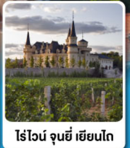
ไรไวน์ จุนยี่ เยียนโก