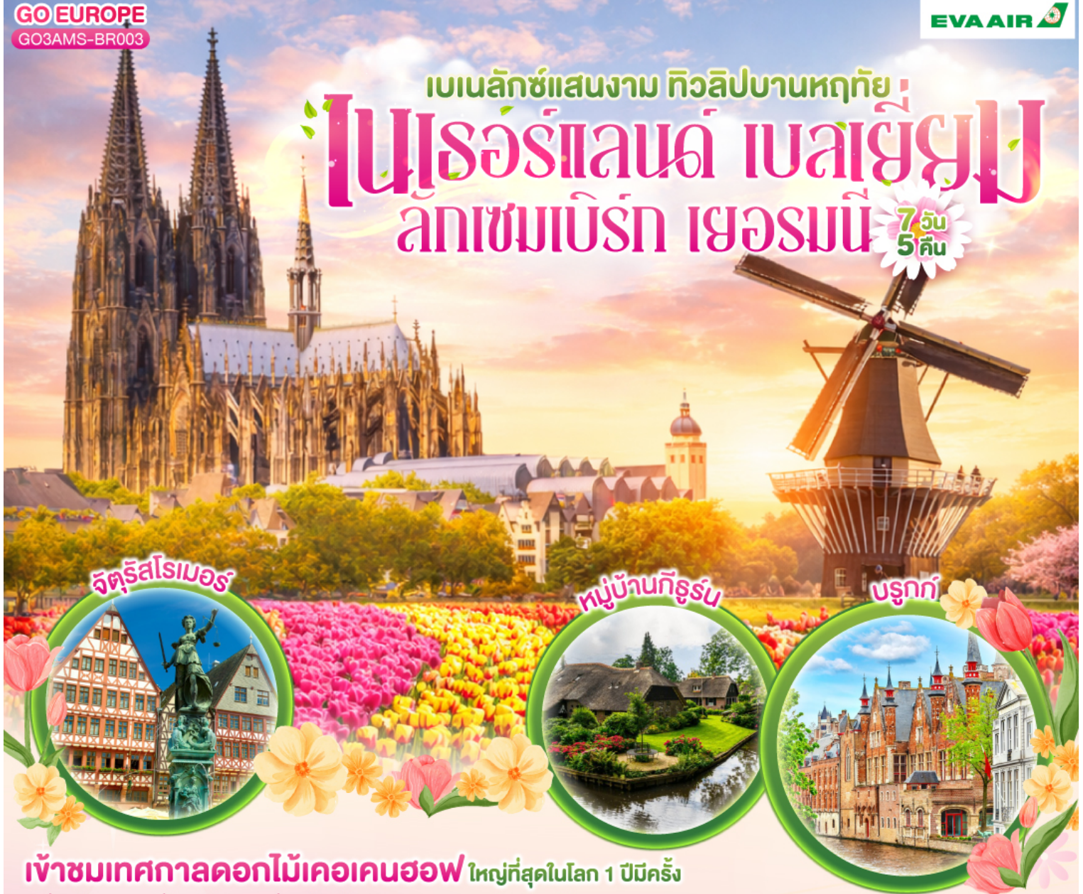
จัตุรัสโรเมอร์