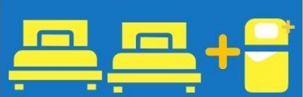
เตียง 3 ท่าน ที่นอนเสริม TRIPLE