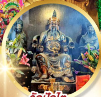
วัดบิกโต

เสริมโชคลาภนำความรุ่งเรือง ทุกด้านของชีวิต