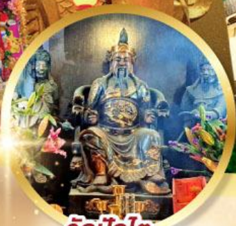
วัดปึกโต

เสริมโชคลางนำความรุ่งเรือง ทุกด้านของชีวิต