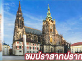
ชมปราสาทปราก