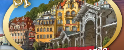
ชมสถาปัตยกรรมคลาสสิก เมือง คาร์โลวี วารี