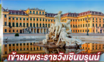
เข้าชมพระราชวังฮับบูร์ก