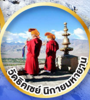
วัดทิคาชย์ นิกายนทพยาน