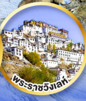
พระราชวังเลห์