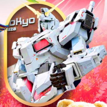
ห้างไอโดเบะกันดั้ม