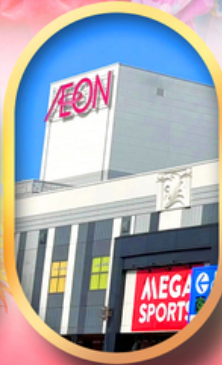
อีออนมอลล์