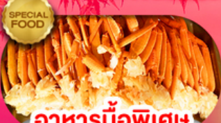
อาหารมือพิเศษ บุฟเฟ่ต์งาปู