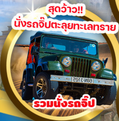
รวมนั่งรถจี๊ป