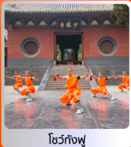
โชว์กังฟู