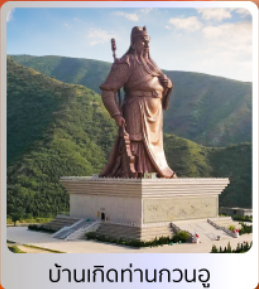
บ้านเกิดท่านกวนอู