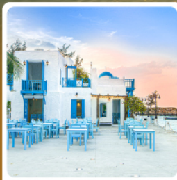
บาร์น้ำกาแฟ