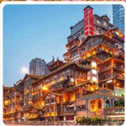
กงหยาดั่ง