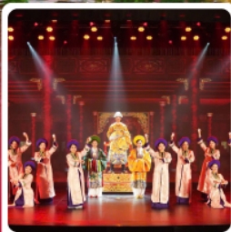
The Heritage Show