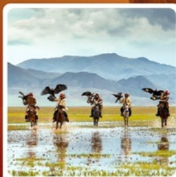
ชนเผ่ามองโกเลีย