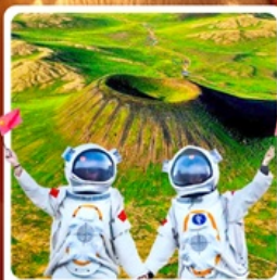
อุทยานภูเขาไฟอุลันฮาตา