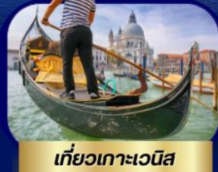
เที่ยวเกาะเวนิส