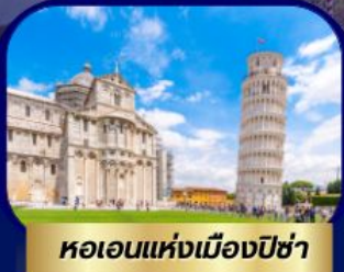
หอเอนแห่งเมืองปิซ่า