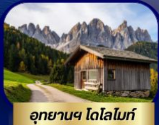
อุทยานฯ โดโลไมท์