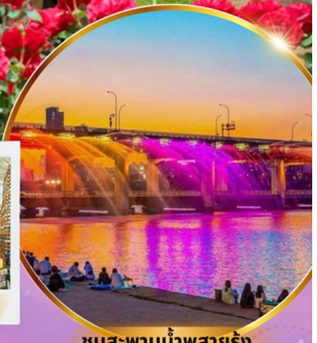
ชมสะพานน้ำพุสายรุ้ง

เชคอินเกาะนามิ สุดโรแมนติก ชมศิลปะดิจิทัลสุดล้ำ บนจอ LED เสมือนจริงขนาดยักษ์ สนุกสุดมันส์ สวนสนุกล็อตเต้เวิลด์ ชมต้นจูนีเปอร์จีนอายุกว่า 1,000 ปี และดอกไม้ตามฤดูกาล อิสระช้อปปิ้ง เมียงดง ช้อปปลอดภาษี Lotte Duty Free