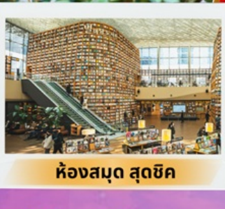
ห้องสมุด สุดชิค