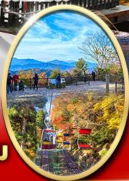
ภูเขา ทาคาโอะ

ปราสาทดสิโมโต้ Starbuck Snow Peak Land วัดชินโซจิ