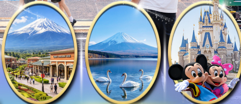
Gotemba Premium Outlets Lake Yamanakako อิสระเลือกซื้อบัตร Tokyo Disneyland

รหัสทัวร์ RJ-XJ133 เส้นทาง 5D 3N ก้นยายน 2569