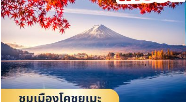
ชมเมืองโคชูยูเมะ