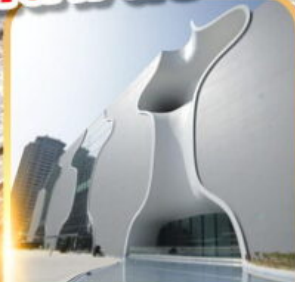
โรงละครไทจง