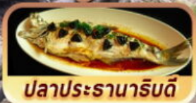
ปลาประจานาโรยดี