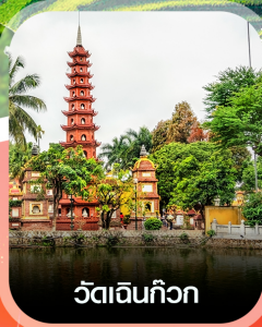
วัดดินทิว๊ก

คอนเฟิร์มออกเดินทาง ทุกพีเรียด 2 ท่านขึ้นไป