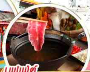
บุฟเฟ่ต์ ชาบูหม้อไฟไต้หวัน