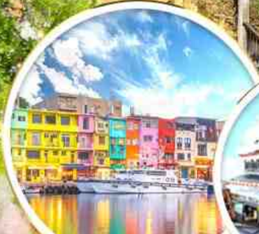
ท่าเรือสายรุ้ง