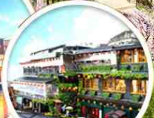
หมู่บ้านโบราณ จ้าวเฟิน