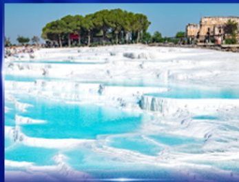
ปราสาทน้ำพุร้อน ปามุกคาเล