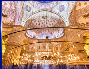
เข้าชมความงามสุเหร่าสีน้ำเงิน