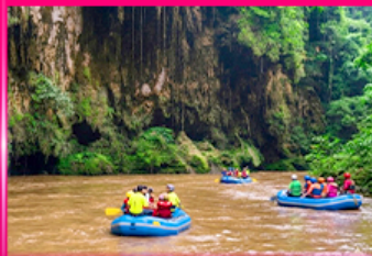
ส่องแก่ง ทีลอสจ่อ - ทีลอสซู