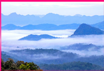
ทะเลหมอก ดอยหัวหมก