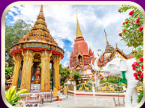
หอพระหลวงปู่ทวด วัดช้างให้