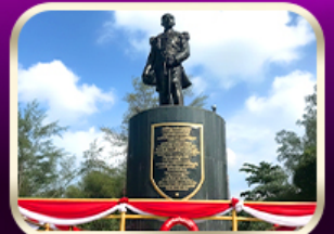
อนุสาวรีย์กรมหลวงชุมพรฯ