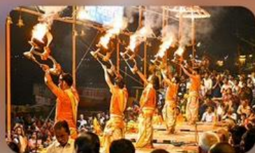
พิธีคงคา อารตี