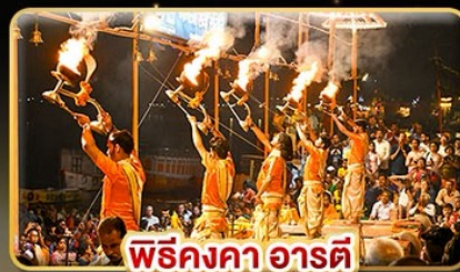
พิธีคองคาอาร์ตี