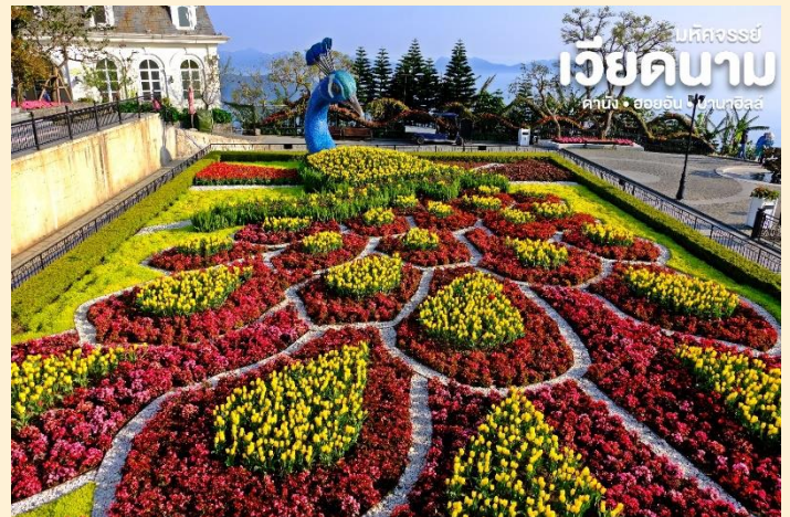
ปัทมาภรณ์ เวียดนาม คาบัง • ฮอยอัน • ไซปารีส

ชมเมืองฝรั่งเศส เป็นตึกออกแบบมาได้ บรรยากาศยุโรปแท้ๆแต่มาเจอได้ใกล้ๆ เพียงแค่เวียดนาม ลัดเลาะไปตามตรอก ซอกซอย มีมุมถ่ายรูปเซ็กซี่อินสวยๆหลาย มุม Le Jardin d' Amour เป็นสวนสวย สไตล์ฝรั่งเศส ที่มีทั้งดอกไม้ต้นไม้ มีมุม ถ่ายรูปสวยๆ เต็มไปหมด รวมไปถึงมี โรง ไวน์ Debay Wine Cellar ด้านในจะเป็น คล้ายๆ อุโมงค์ใต้ดินไวน์บ่มไวน์ เป็นทางยาวเดินทะเลซมไปเรื่อยๆ ก็จะออกมาที่สวน นอกจากนี้