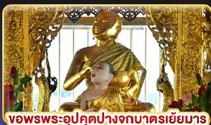
ขอพระอุปคุตปางจกบาตรเรียมาร