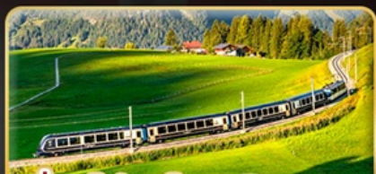
นั่งรถไฟสายโรแมนติก 2 สาย Golden Pass / Luzern Interlaken Express