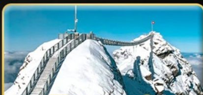
พิชิต 3 ยอดเขาดัง Rigi / Schilthorn / Glacier 3000