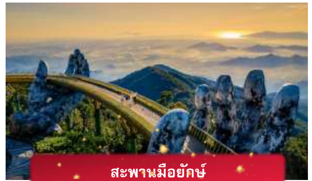
สะพานมอญักษ์

นำท่านชม สะพานมอญักษ์ แหล่งท่องเที่ยวใหม่ล่าสุดซึ่งอยู่บนเขาบานาฮิลล์ เป็นสะพานสีทองทอดยาวโดยมีมือ 2 ข้างอุ้มไว้ ตั้งอยู่ในตำแหน่งที่โดดเด่นเห็นชัด สวยงาม นำท่านชม สวนดอกไม้แห่งความรัก เป็นสวนดอกไม้สไตล์ฝรั่งเศส ที่มีดอกไม้หลากหลายพันธุ์ถูกจัดเป็นสัดส่วนอย่างสวยงามท่ามกลางอากาศที่แสนเย็นสบาย นำท่านชม สักการะพระพุทธรูปหินอึ้ง เป็นพระพุทธรูปหินองค์ใหญ่ตั้งตระหง่านบนยอดเขาแห่งนี้ ให้ท่านได้ขอพรเพื่อความเป็นมงคล นำท่านชม ป๊อปมาร์ท เป็นร้านค้าของเล่นเปิดใหม่ล่าสุดที่อยู่บนยอดเขาบานาฮิลล์ มีสินค้าของเล่นสำหรับนักจุ่มมากมายให้ท่านได้เลือกชมกับตัวละครน่ารัก อาทิเช่น Molly, SkullPanda, Labubu หมายเหตุ: การจัดการ และข้อกำหนดในการเข้าชมสินค้าอยู่นอกเหนือการจัดการของบริษัททัวร์