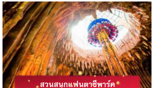
สวนสนุกแฟนตาซีพาร์ค

อิสระท่านท่องเที่ยว สวนสนุกแฟนตาซีพาร์ค ซึ่งมีเครื่องเล่นหลากหลายรูปแบบ เช่น ทำทายความมันส์ของหนัง 4D ระทึกขวัญกับบ้านผีสิง เกมส์สนุกๆ เครื่องเล่นเบาๆ รถบั๊ม หรือจะเลือกช้อปปิ้งของที่ระลึกของสวนสนุก และ จัตุรัสแห่งดวงดาว เปรียบเสมือนการเดินทางสู่อาณาจักรแห่งดวงดาว ที่มีเส้นทางเชื่อมต่อระหว่างอาณาจักรแห่งดวงจันทร์และอาณาจักรแห่งดวงอาทิตย์ถนนที่แสงงดงาม และสถาปัตยกรรมที่ล้ำสมัยจุดเด่นของที่แห่งนี้ก็คือกระจกใสทรงสามเหลี่ยมที่ดูคล้ายกับพิพิธภัณฑลลูฟวร์ที่ฝรั่งเศส ให้ความรู้สึกเหมือนท่านกำลังท่องอยู่ในโลกแห่งเวทมนต์และดวงดาว (ไม่รวมค่าเข้าชมหุ่นขี้ผึ้ง)