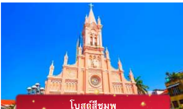
โบสถ์สีชมพู

ค่า บริการอาหารค่ำ ณ ภัตตาคาร พิเศษ ... เมนูบุฟเฟ่ต์ปิ้งย่าง ที่พัก MAGNOLIA HOTEL เทียบเท่าหรือระดับ 4 ดาวท้องถิ่น