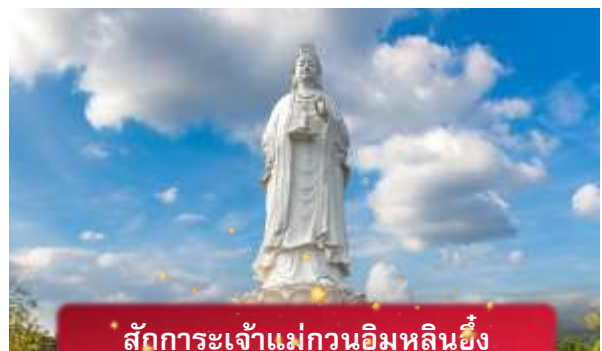
สักการะเจ้าแม่กวนอิมหลินอึ้ง