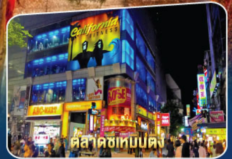
ตลาดซีเหมินตึง