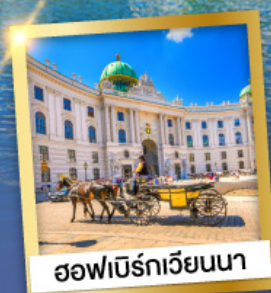
ฮอฟบิรเกาเวียนนา