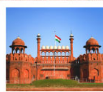
♡♡♡ Agra Fort