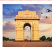
♡♡♡ India Gate