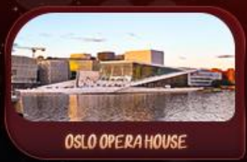
OSLO OPERA HOUSE

รหัสโปรแกรม : SEK156 9วัน 6คืน เที่ยวบินโฮล์ม-ออกโคเปนเฮเกน