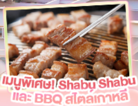
เมนูพิเศษ! Shabu Shabu และ BBQ สไตล์เกาหลี

เดินทาง พฤศจิกายน - ตุลาคม 69 สายการบิน AIR BUSAN (BX) AIR BUSAN น้ำหนักกระเป๋า 15 KG