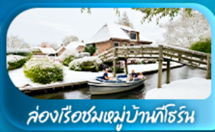
คลองเรือชมหมู่บ้านทโรริน

พิเศษ ล่องเรือแม่น้ำเซน ชมเมือง โดย บาโต มูช