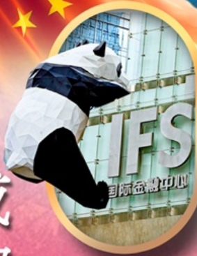
IFS หมีแพนด้าปิ่นตึก