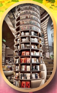
อุทยานบี๋ผิงโกว