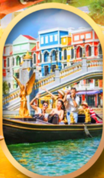
เวนิสแห่งเวียดนาม