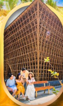
อาคารไม้ไฟ