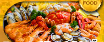
พิเศษเมนูซีฟู้ดบุฟเฟ่ต์ 11 มื้อ เดินทาง มีนาคม 2569