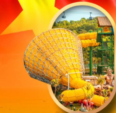
สวนน้ำ Hon Thom