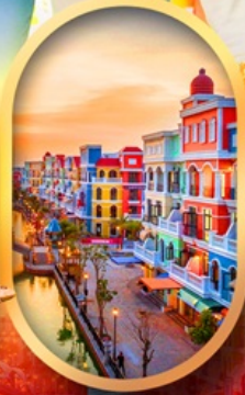
เวนิสแห่งเวียดนาม