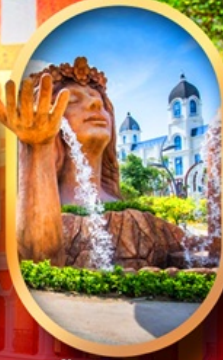
น้ำตกเทพหญิง