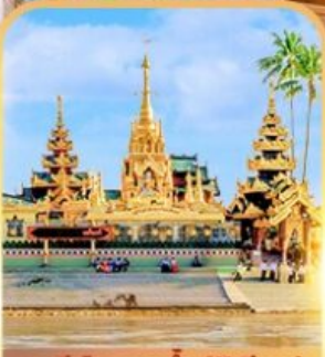
เจดีย์กลางน้ำ (สิริเยม)