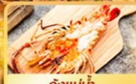
กุ้งแม่น้ำ