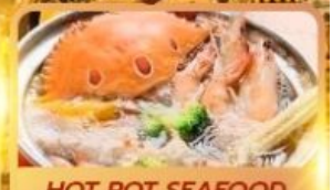
HOT POT SEAFOOD