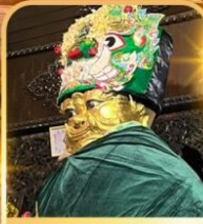
แม่ยี่กษ