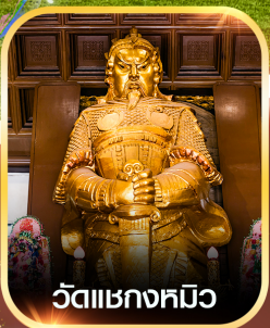
วัดแซกกงหิว

✈️ คอนเฟิร์ม ออกเดินทาง ทุกพีเรียด 2 ท่านขึ้นไป