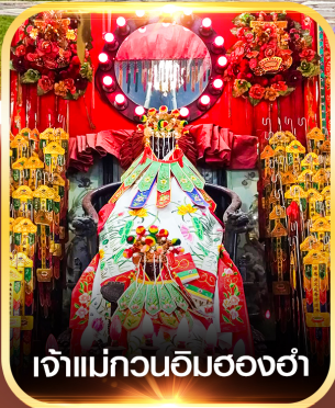
เจ้าแม่กวนอิมองค์