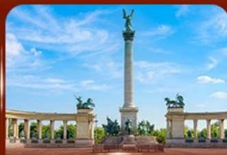
จัตุรัสวีรบุรุษ บูดาเปสต์