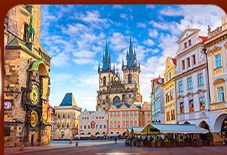
ชมย่านเมืองเก่า ปราก