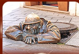
แลนด์มาร์คดัง รูปปั้นคูนิล ปรากติสลาวา