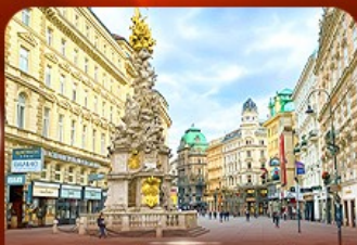
คาร์ทเนอร์ สตรีท ออสเตรีย