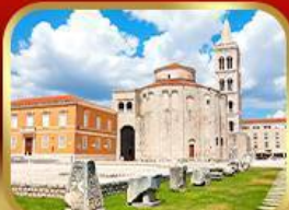
โบสถ์เซ็นต์โทมัส ซาดาร์