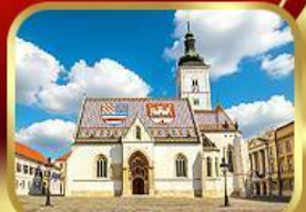
โบสถ์เซ็นต์มาร์ก ซาเกรบ