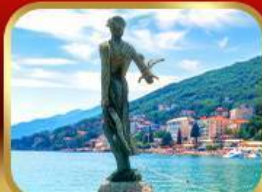
ราชินีแห่งอาเดรียติก โฟพาทิช