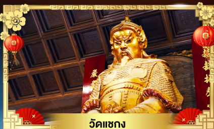
วัดเซี่ยง

เข้าร่วมพิธีเปิดทองพระคลังเจ้าแม่กวนอิมฮ่องกง “เปิดดวงเศรษฐี 1 ปีมีครั้งเดียว” บินทรูกลับแบบเศรษฐี BUSINESS CLASS